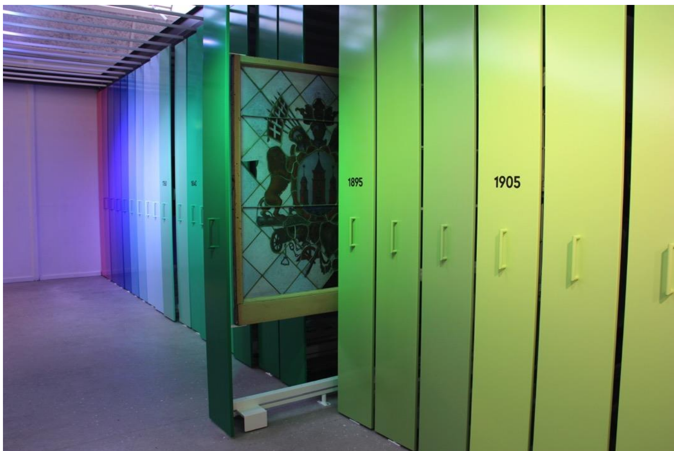
Vindue fra Tivolislottet.