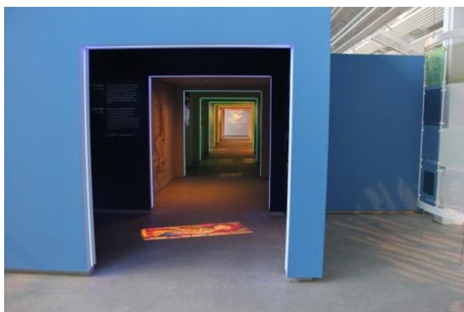
Tidstunnelen i udstillingen