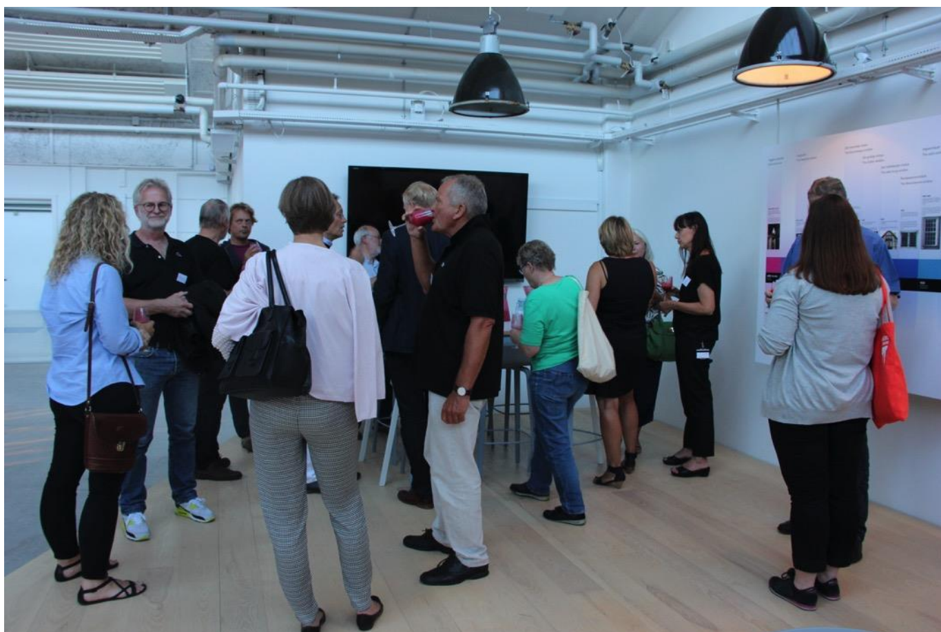
Efter rundvisningen i den meget fine udstilling afslutter vi eftermiddagen med hyggelig networking.