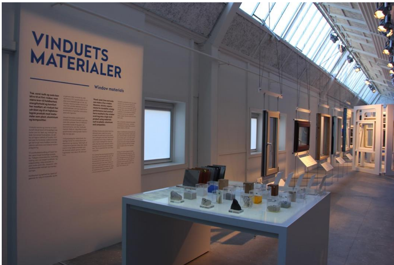
De forskellige materialer der anvendes til at producere et vindue.