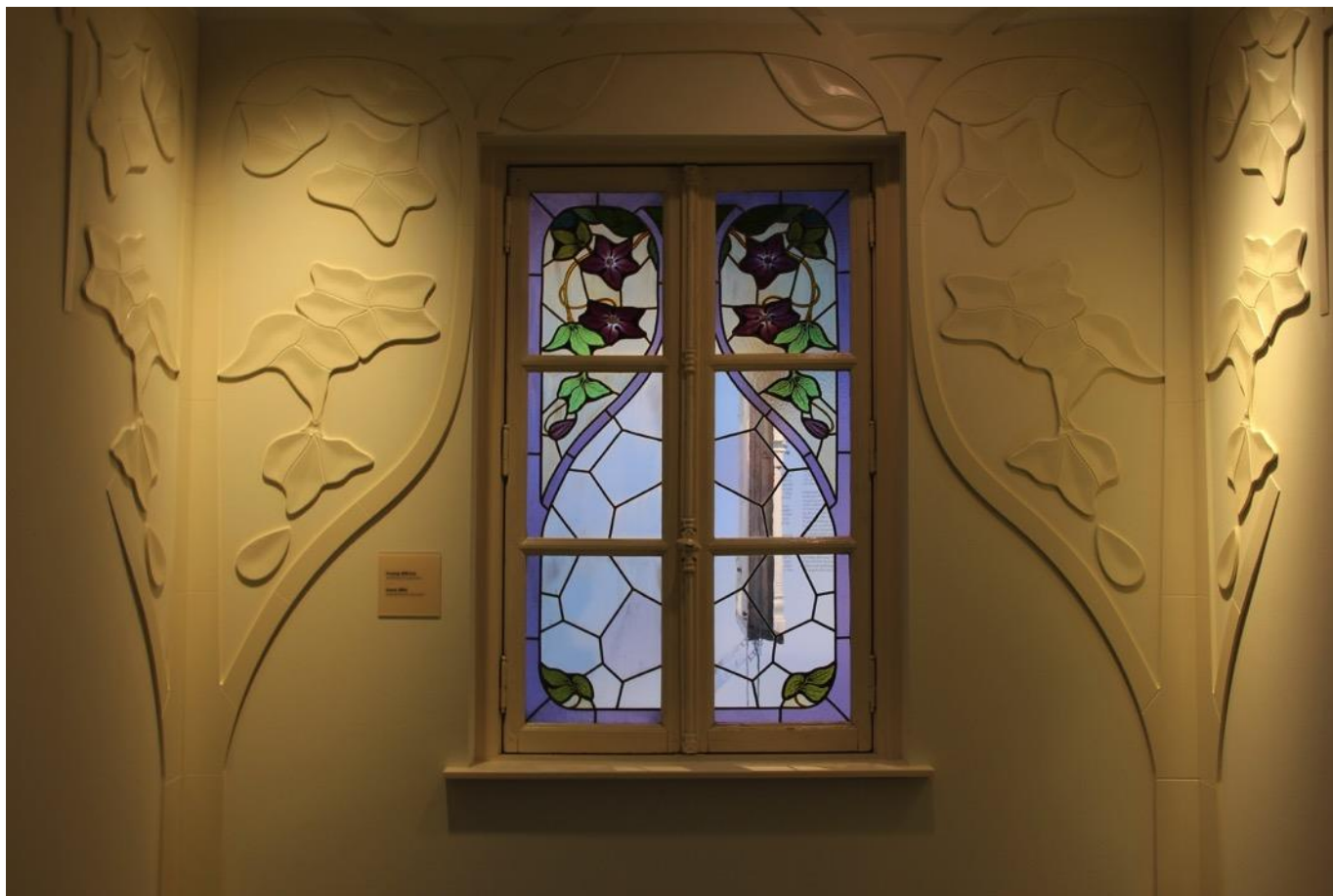
Et fransk vindue fra 1890'erne.