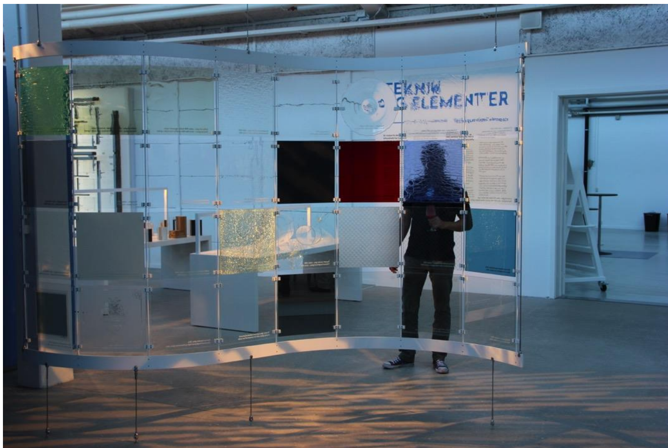
En glasvæg bestående af forskellige typer glas.