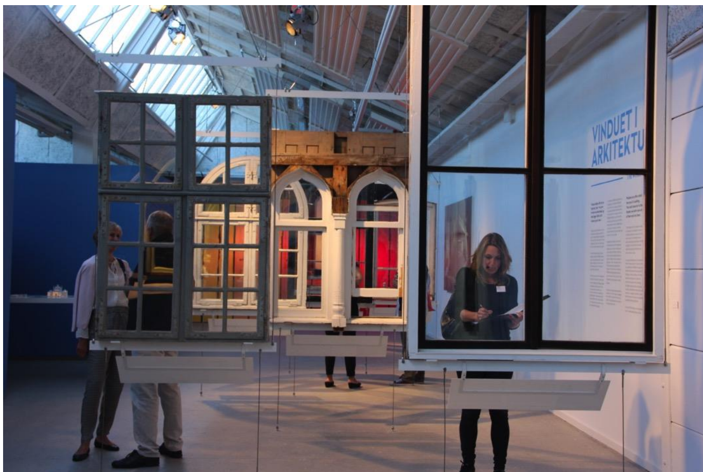
VILLUM Window Collection består af ca. 300 vinduer fra 1600-tallet og frem til i dag.